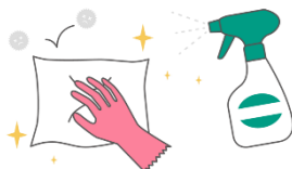
定期的な室内の消毒作業