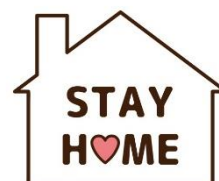
ステイホームの推奨