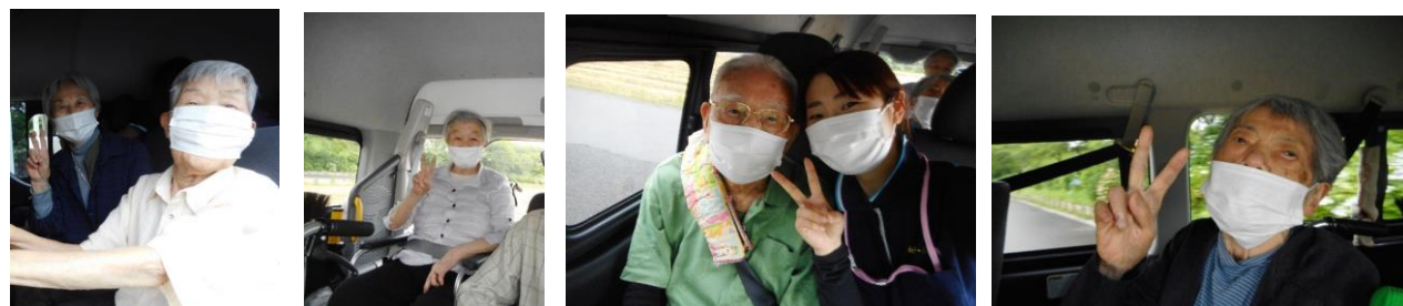
あじさい見学に ピースサインも