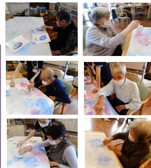
ポンポン押すと あじさいの花びらに!