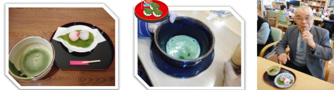
お抹茶をたて頂き、 おやつに桜餅と共に 召し上がって頂きました♪