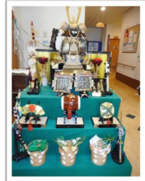
皆さんで作上げた こいのぼりと五月人形です！